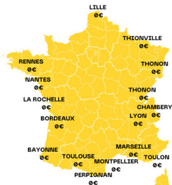
CARTE DES PRINCIPAUX SITES DE FRANCE OUBLIÉS PAR LA PRIME VIE CHÈRE

OFFRE RÉSERVÉE AUX AGENTS N'AYANT NI CAM NI AIL NI ANL NI MSD ET TOUCHANT MOINS DE 2300€/MOIS.