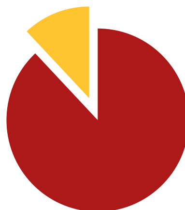
90% DES SITES DE FRANCE SONT TOTALEMENT EXCLUS DU DISPOSITIF